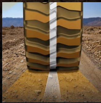
Offenes Profil mit geschlossenem Mittellaufstreifen